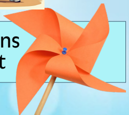
Moulins à vent